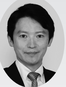
兵庫県知事 齋藤 元彦